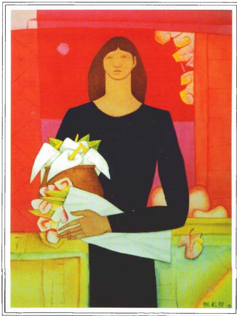
VENTANA ROJA - Acr lico sobre tela, 80cm x 60cm - 1998