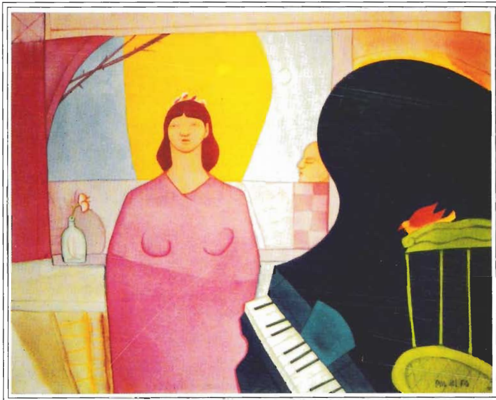
MUJER CON PIANO. 80cm x 100cm Acrílico sobre Tela. 1998

Por otra parte, se percibe el acercamiento a los senderos dejados por las propuestas de Diego Rivera y el muralismo mexicano, quienes plantearon la problemática de la creación plástica desde América, a través de personajes anónimos y las actividades que los caracterizaban dentro de la sociedad; ya sea por representar una idiosincrasia particular o por su papel dentro de las relaciones de producción del capitalismo latinoamericano. Este último aspecto resulta significativo para la obra de Paúl Del Río, quien ha explorado en torno a la integración entre las tendencias pictóricas modernas y el lenguaje simbólico que encierra una imagen, aparentemente cotidiana, pero simultáneamente cargada de estímulos hacia la percepción de una realidad.