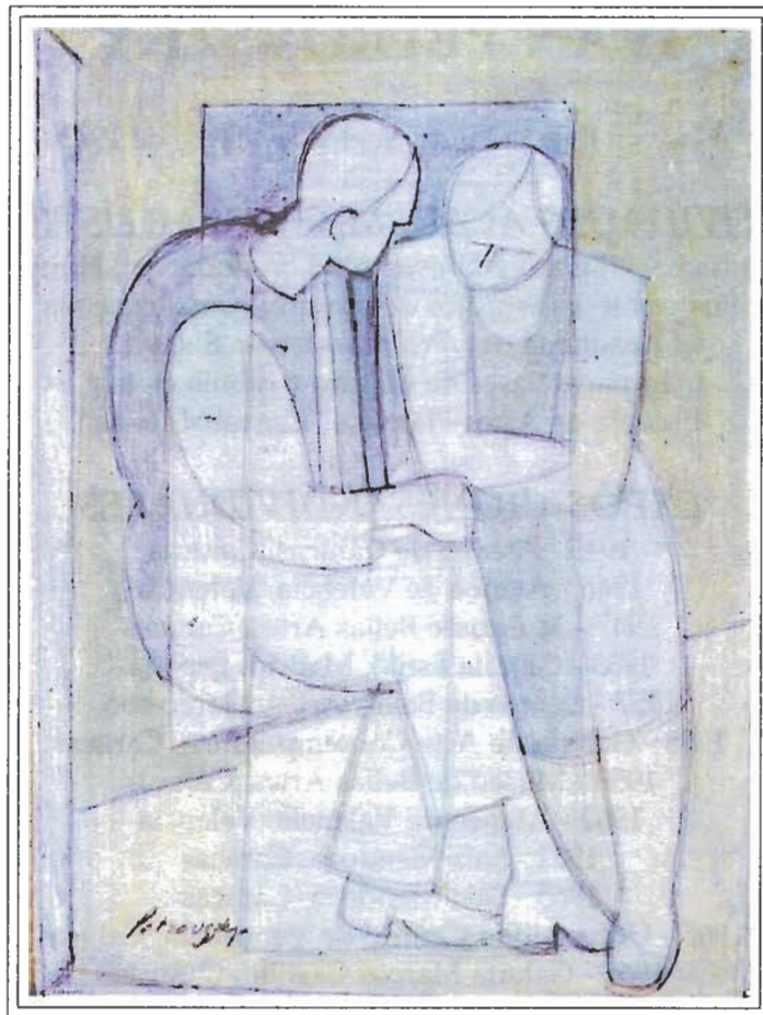
PAREJA EN GRIS - TEMPERA SOBRE PAPEL, 40 x 29 cm - S/F

Todo ello ha reportado al artista el mote de solitario. Efectivamente, Petrovsky ha permanecido retirado de cofradías o clubes que hicieron época; ha estado apartado del besamanos social, y su tiempo solo transcurre en su taller y en ciertas calles de Caracas (porque de Caracas se trata) donde toma sus apuntes de modelos en vivo, los cuales luego lleva tanto a su obra sobre papel como a su pintura.