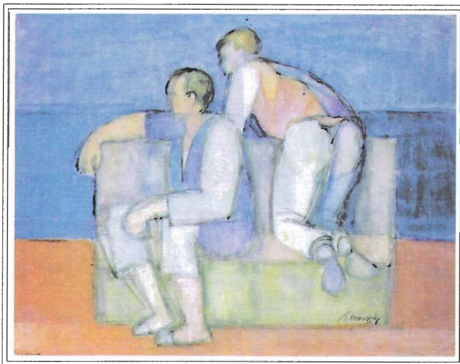
DOS FIGURAS - TEMPERA SOBRE PAPEL, 50 X 65 cm - S/F

Siempre he imaginado la obra de Petrovsky dentro de los grandes temas de la cultura moderna como son la espera y la melancolía.