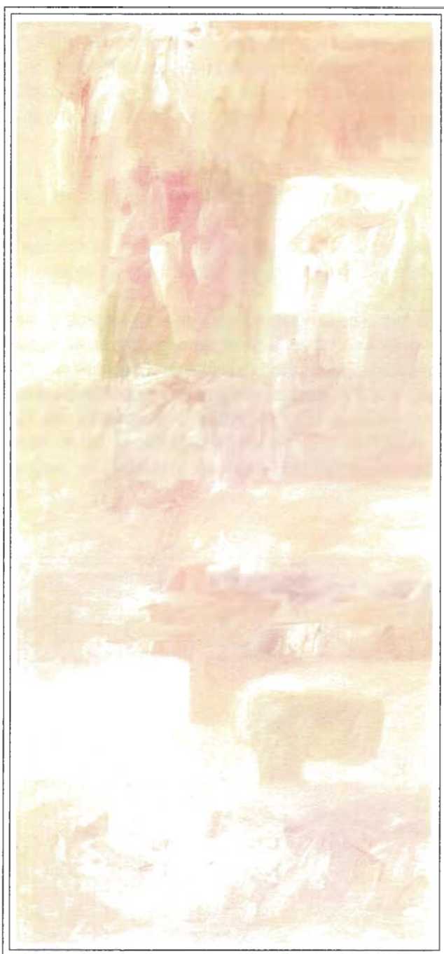
Gran Arbol - Óleo sobre tela - 1998

El sentido compositivo de esta obra se establece a partir de la improvisación - en la fortuna de lo que carece de reparación- en el instante en que sucede el encuentro con la materia y la tela. La impresión de esa pasión, de ese hallazgo, es esta exposición. Entonces el artista podría decir con la voz del poeta colombiano Juan Antonio Roda, "veo, intuyo, asocio, imagino, agrego".