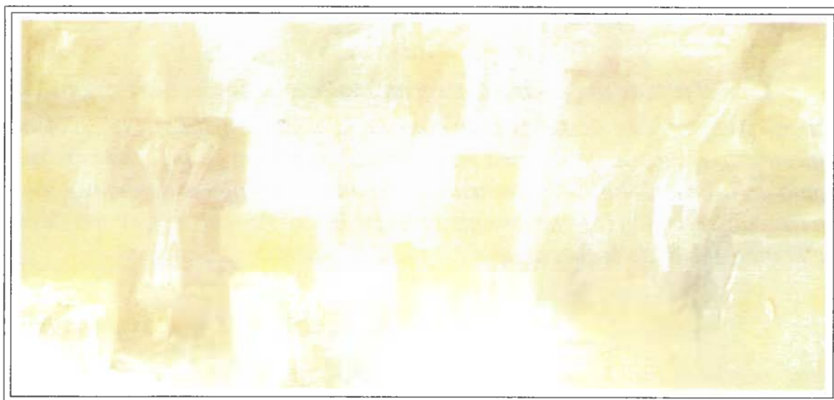
Mujer en Blanco - Óleo sobre tela - 1998

Enrico Armas se dedica a la pintura desde finales de la década de los ochenta y su primera muestra como tal, data de marzo de 1992. Por todo lo anterior, se evidencia que estamos ante una personalidad artística muy compleja, lo cual se complica un poco cuando distinguimos que sus fraseos formales pasan con toda tranquilidad de los códigos figurativos a planteamientos constructivistas, tanto como del oficio de escultor al de pintor, pero, raíz de una nueva visita a su taller, esta situación comienza a acoplarse cuando en una misma tela hallamos que el lápiz de grafito define líneas finamente figurativas sobre un fondo de dinámica constructiva del color.