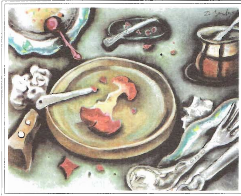
DESPUÉS DEL ALMUERZO - PASTEL SOBRE CARTULINA KIMBERLY, 70 X 100 cm - 1997-98