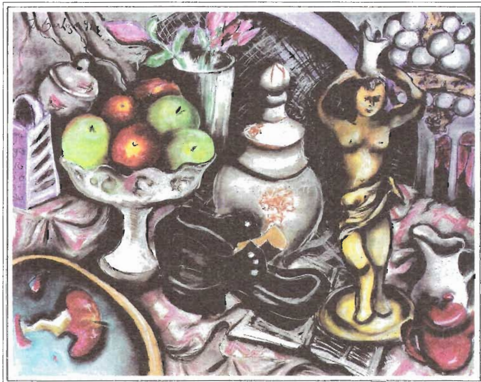
RECUERDO DE FAMILIA - PASTEL SOBRE CARTULINA KIMBERLY. 82 X 102 cm - 1997-98

De sus apropiaciones de Cézanne con sus naranjas, de Caravaggio con sus manzanas y uvas o de Van Gogh con sus girasoles, no puede hablarse de desacralización, puesto que ellas son meditaciones íntimas llevadas a cabo a partir del corazón, ellas están guiadas por el amor y por un sentido de belleza.