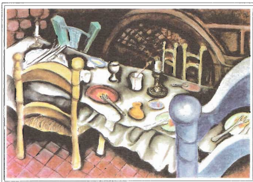
PARÉNTESIS DE LA GULA - PASTEL SOBRE CARTULINA KIMBERLY, 70 X 100 cm - 1997-98

A partir de sus inicios, una de las características de la obra de Barboza ha sido la distorsión de la imagen. Como constante, esta distorsión se presenta como la ideología que anima su trabajo, en el que no se percibe una atmósfera contestataria, pero sí una posición transgresora de la realidad del ser humano y su contexto. Barboza transgrede los códigos plásticos tradicionales, estando en control de cualquiera de los medios que ha seleccionado para expresarse, sea el dibujo, los performances, el collage o la pintura misma. Al lado de esto, otra constante ha sido su “preocupación por el hombre, por la vida, por lo cotidiano (2).